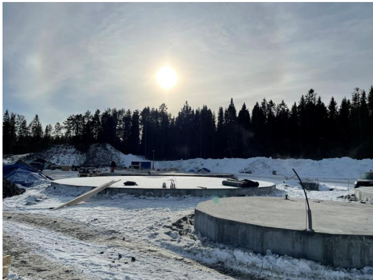
RK2 till vänster och RRB till höger