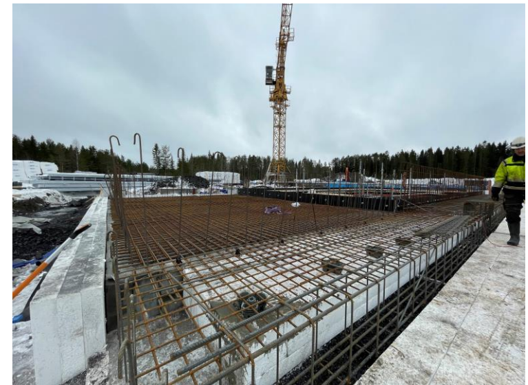
Armering av valv ovan regnvattenlager