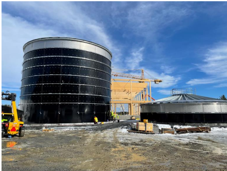
Montering av RK1 i betongplatta