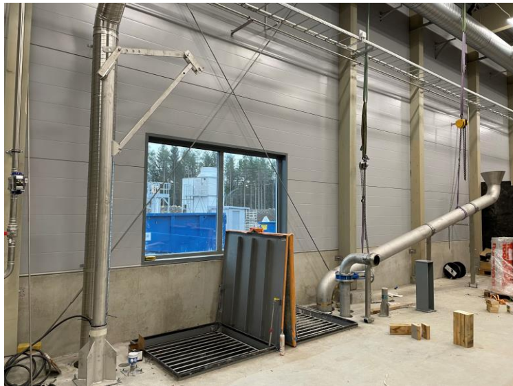
Mottagningshall flytande substrat