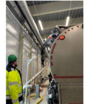
Mottagning av flytgödsel

Reception of food waste in reception pocket